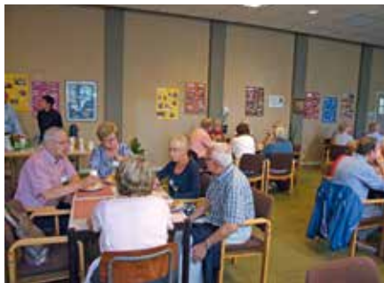
Lunchen in één van de ruimtes van Mariadal

De ene streek neer in de tuin van Mariadal, een ander vertrok naar een terras op de Markt en een derde stapte museum Tongerlohuys in,