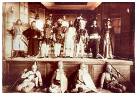
De spelers van het seminarietoneel in 1907

Zijn boek van 530 pagina's start in 1848 als notabelen verenigingen oprichten om het volk te verheffen en de geestelijken de toeschouwers stichtelijke taferelen voor willen schotelen. Die historie loopt door tot het jaar 2000 met het Shakespearement in Zundert. Daar voerden amateurgezelschappen drie weken lang stukken van Shakespeare op in een nagebouwde globe.