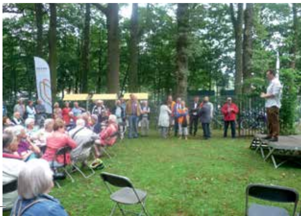
De ontvangst op de tweede dag in Essen in België

als herinnering aan activiteiten die daar in de Eerste Wereldoorlog plaatsvonden. Een verrassing was een bezoek aan het klooster en de bibliotheek van het Rouwmoer College. Pas op de ochtend zelf was dat aan het programma