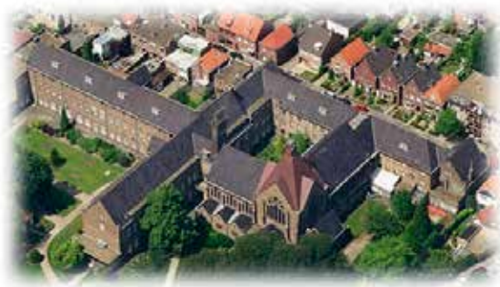
Het klooster Mariadal in Roosendaal

Om kwart voor vier gaat het plenaire programma verder met de film 'Bevrijding om nooit te vergeten'. De dag wordt afgesloten