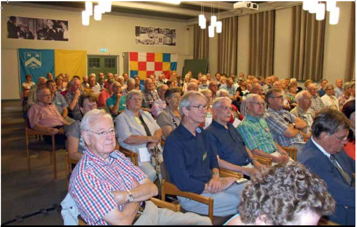
De deelnemers aan de Brabants Heemdagen in de zaal van Mariadal

Brabants Heem wil de ondersteunende organisatie zijn voor 127 zelfstandige Brabantse heemkundekringen. De stichting organiseert cursussen en studiedagen, zet netwerken op en geeft adviezen. Dat alles om de deskundigheid van de kringleden te bevorderen op alle terreinen waar dat nodig is. Verder stimuleert Brabants Heem nieuwe initiatieven en onderlinge samenwerking. Brabants Heem: van vrijwilligers voor vrijwilligers.