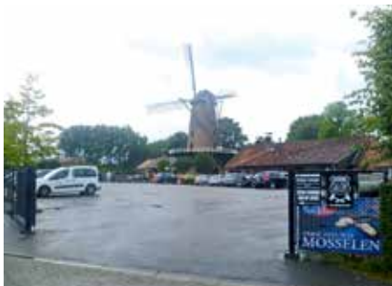
De Bakkersmolen in Wildert waar de lunch gebruikt werd

's Middags reden de groepen de omgekeerde volgorde, gelukkig was het inmiddels droog geworden en iedereen kwam uiteindelijk weer terecht bij de Kiekenhoeve voor het koud en warm buffet.