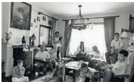
Ook tegenwoordig zijn er nog grote gezinnen

„De afgelopen periode heb ik me verdiept in alles wat met grote gezinnen te maken heeft en met grote gezinnen worden huishoudens bedoeld met minimaal acht kinderen, maar ik kwam ze ook tegen met 27 of 28 kinderen. Uit de vele verhalen en illustraties die ik tegenkwam, heb ik intussen een lezing gemaakt met veel prachtig illustratiemateriaal, die ik graag voor verenigingen en kringen wil verzorgen”, zegt hij.