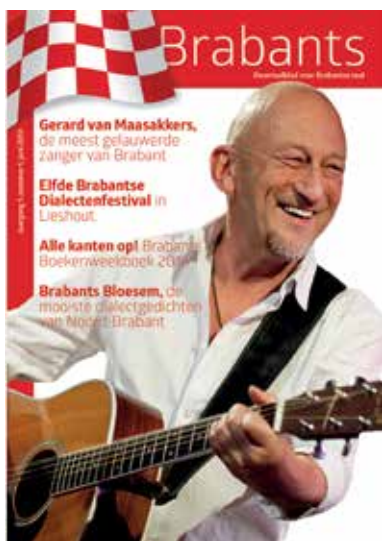
Cover van het eerste nummer van Brabants