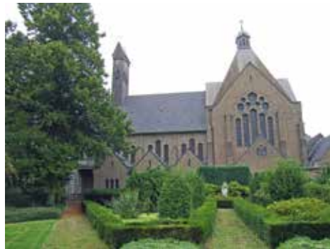
De kapel van het klooster Mariadal