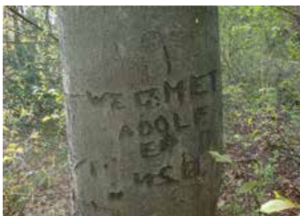
Een duidelijk mededeling uit WO II

zoek op enig moment wat oplevert. Dat ze het nu op deze manier faciliteren, is natuurlijk heel mooi. Het is echt een passieproject, en dat is het voor mij ook, dus ik wil hier graag mee doorgaan.”