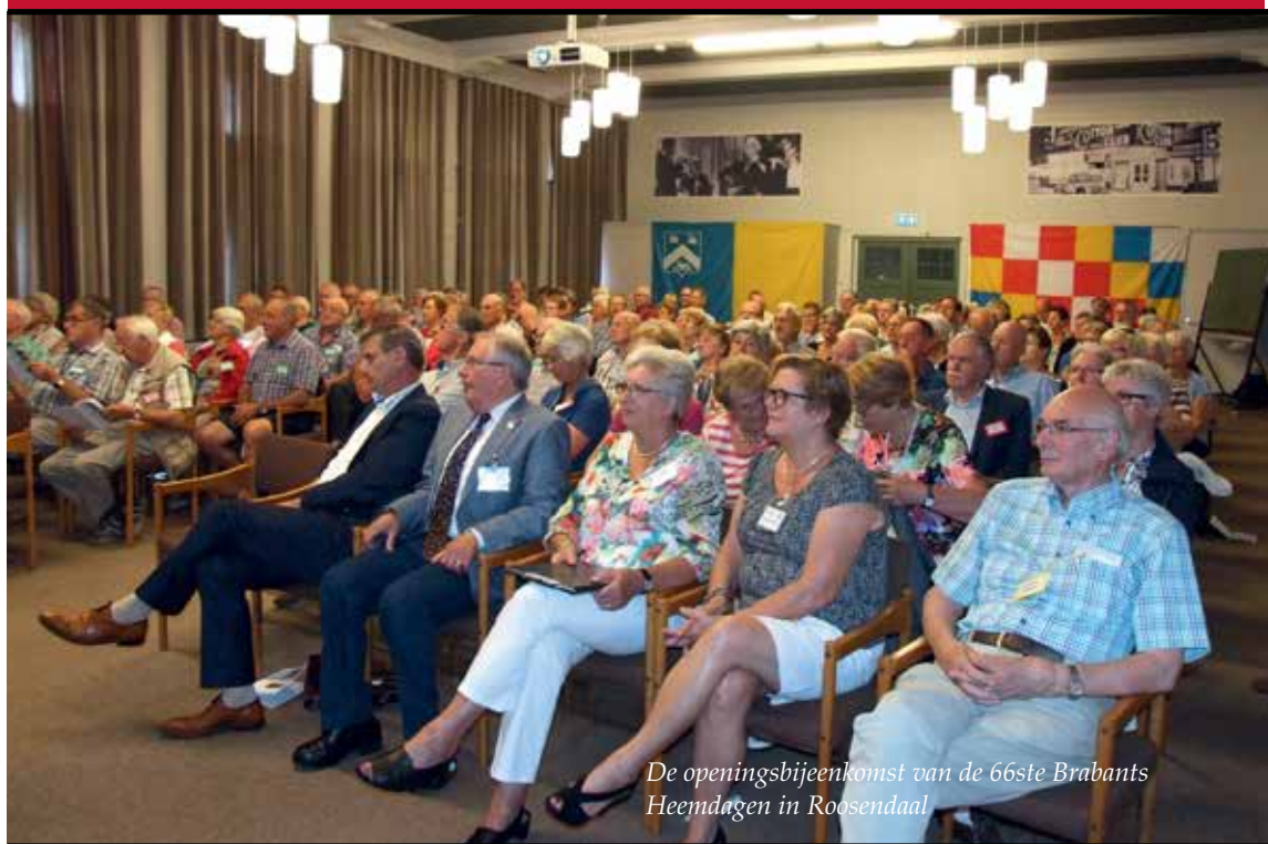
De openingsbijeenkomst van de 66ste Brabants Heemdagen in Roosendaal