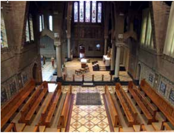
De kapel van klooster Mariadal

Duitsers en aan de ander kant het prikkeldraad aan de Nederlandse grens. Zo werd Essen in een 'kiekenkot' veranderd, vonden de inwoners van dit dorp", besloot de Roosendaalse archivaris.