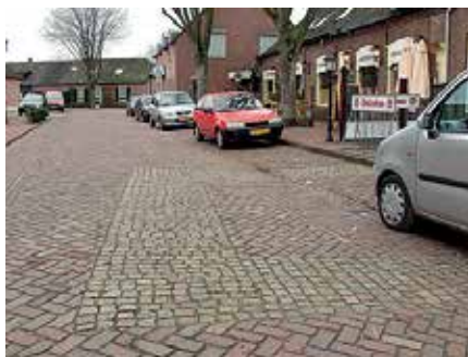
In het wegdek van het Tooseplein is de plek gemarkeerd van de vroegere kerktoren. De locatie blijkt onjuist en bevindt zich aan de overkant van de straat

De bestrating markeert de plek waar de toren zou hebben gestaan van de schuurkerk die op 23 mei 1864 afbrandde. Het onderzoek Jan van de Sande wees uit dat de toren aan de overkant van de straat heeft gestaan. In 1992 verkocht de parochie Sint-Jans Onthoofding een perceel grond van 60 vierkante meter aan de toenmalige gemeente Liempde. Op het perceel zou tot in de negentiende eeuw de Liempdse kerktoren hebben gestaan. De parochie verkocht de grond aan de gemeente voor een symbolisch bedrag van één gulden op voorwaarde dat de omtrekken