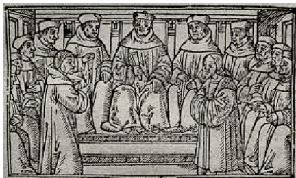
Een houtgravure van een middeleeuwse schepenbank

KEMPEN - Op zaterdag 25 oktober verzorgen Brabants Heem en het Centrum voor de Studie van Land en Volk van de Kempen hun jaarlijkse gezamenlijke congresdag in Baarle-Nassau-Hertog.