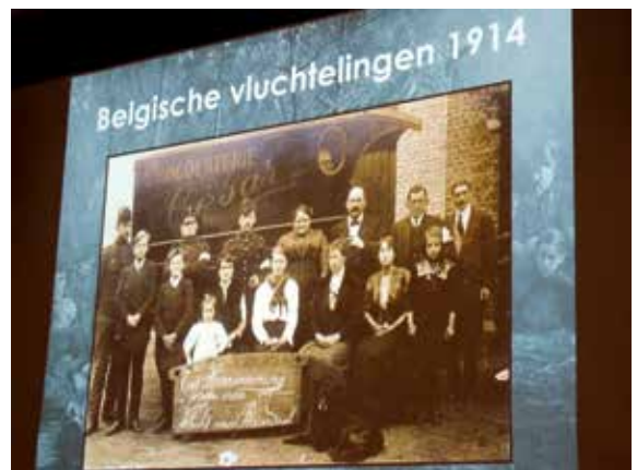
De presentatie met foto's van de Belgische vluchtelingen

De aanwezigheid van de Belgen, die vaak toch wat andere gewoonten hadden, leidde wel eens tot in onze ogen hilarische toestanden. Zo vonden de Roosendaalse burgers dat het niet kon om in dagelijkse kleding op zondag naar de kerk te gaan! En vrouwen die zonder een man naar het café gingen, dat kon al helemaal niet.