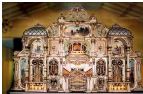
Eén van de orgels in de Gaviolizaal in Helmond