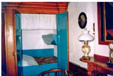
De Bedstee van heemkundige kring Fijnaart en Heijningen die een nieuw leven gaat leiden in Bladel

mee doet, maar dat een andere kring mogelijk kan gebruiken, laat het ons dan weten. Liefst met een foto natuurlijk. U kunt dat mailen naar martel6@hetnet.nl .