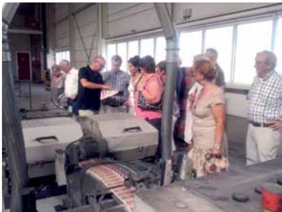
Het bestuur van Brabants Heem op bezoek bij drukkerij De Jong