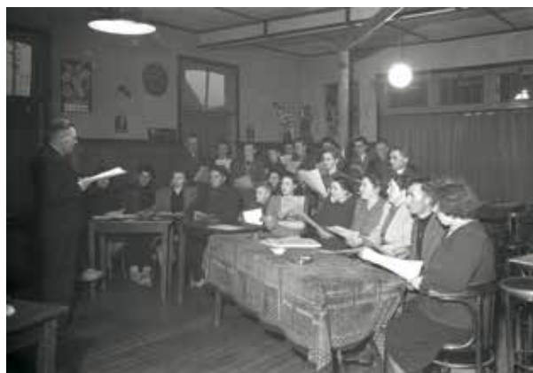
Een emigratiecursus die in 1950 in de plaats Zeeland werd gegeven

In overleg met de cursisten wordt op 3 of 10 januari 2015 nog een