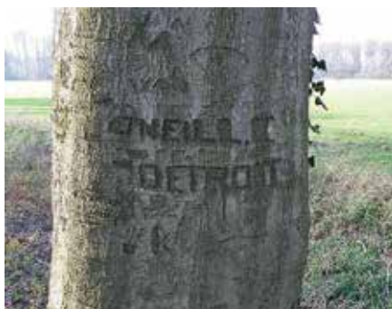
De boom met de tekst waar het allemaal om draait

Bas Visscher was namens Konijnenberg bezig met een boomveiligheids-onderzoek toen hij stuitte op diverse beuken met inscripties. Het jaartal bij één van die inkervingen wees op plaatsing ten tijde van de Tweede Wereldoorlog en nader onderzoek bevestigde dit. Visscher plaatste diverse oproepen in vakbladen en regionale media. Bovendien mocht hij zijn verhaal doen bij het tv-programma Gelderse Koppen van Omroep Gelderland. In totaal kwamen er zo'n dertig reacties binnen met tips