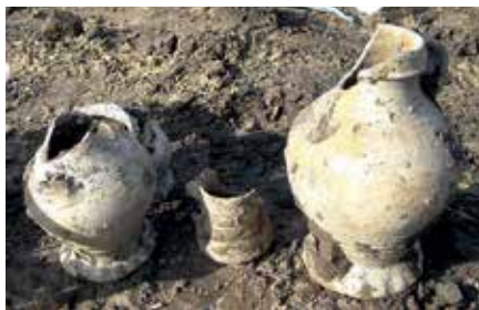
Enkele stukken aardewerk nadat ze net opgegraven waren in 't Broek bij Mierlo

MIERLO – In het Mierlose buitengebied zou een stal gebouwd worden. Een archeologisch onderzoeksbureau had het gebied het stempel 'lage archeologische verwachting' gegeven. Het pakte anders uit dankzij amateurarcheologen Henk van Sleuwen en Henk Simons.