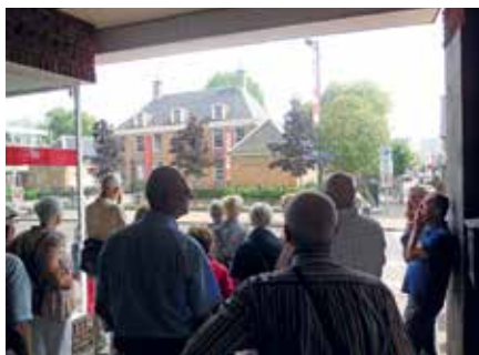
Bij het Tongerlohuys in de Roosendaalse Molenstraat