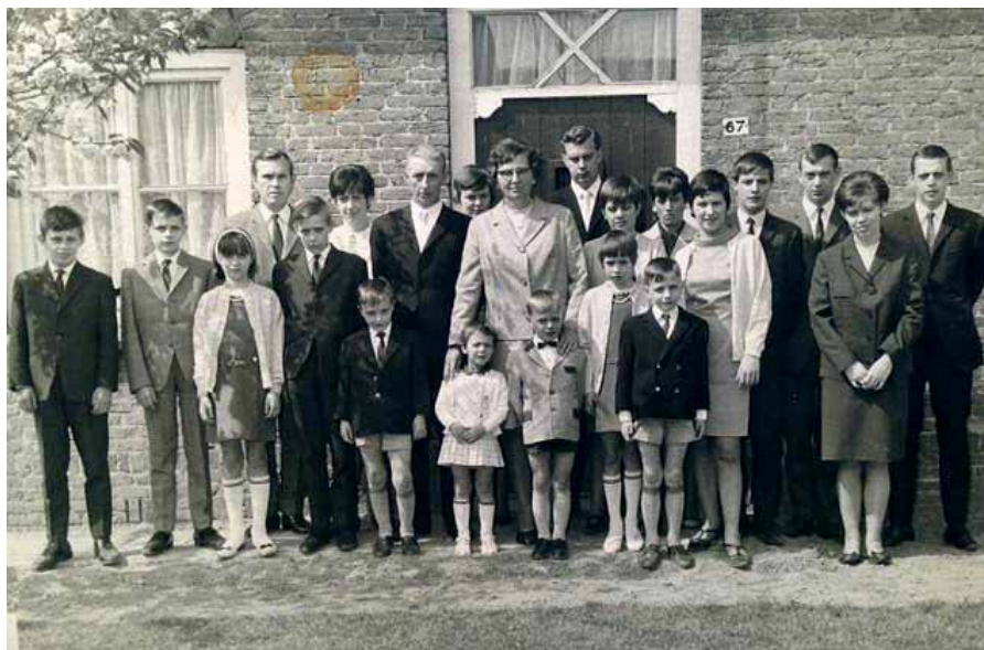
Een foto van een groot gezin uit Bergeyk