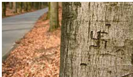
Een hakenkruis als voorbeeld van boomker- ven

Het gaat niet alleen om mededelingen die door soldaten in Gelderse bomen zijn gekerfd. 'Oranje boven', 'Weg met Adolf en de NSB' of simpelweg een hakenkruis zijn enkele voorbeelden van wat werd gevonden. Maar het zijn inscripties als 'O'Neill, Detroit' die aanleiding geven tot nader onderzoek. Met zo weinig informatie komt daar heel wat bij kijken.