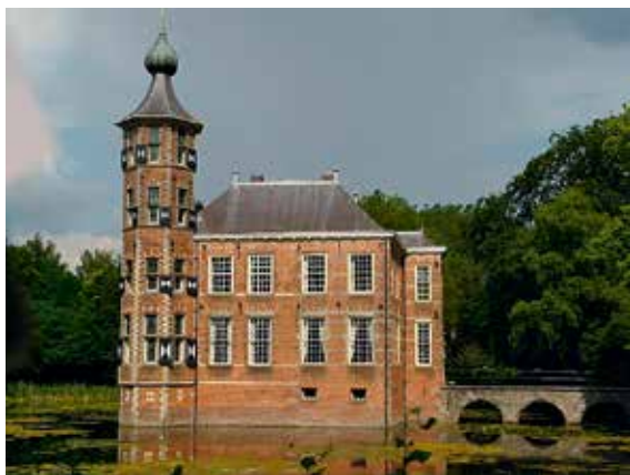
Kasteel Bouvigne in Breda

Het volledige programma en de manier waarop u zich kunt aanmelden staat op de site www.hvbrabant.nl .