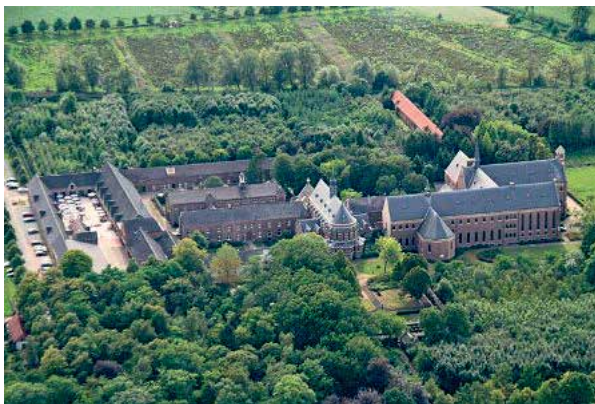
Abdij De Achelse Kluis in de gemeente Hamont-Achel