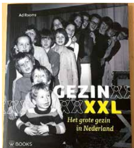
De band van het boek over grote gezinnen

Het verhaal vertelt de geschiedenis van grote gezinnen, dus hoe en waarom zijn ze ontstaan, hoe speelde de overheid daar op in, hoe leefden ze, aten ze, hoe werden de slaapplekken verdeeld, hoe brachten ze hun vrije tijd door, hoe kwamen ze aan voldoende financiële middelen en kleding, wat gebeurde er tijdens de feestdagen? Er komen ook ervarings-