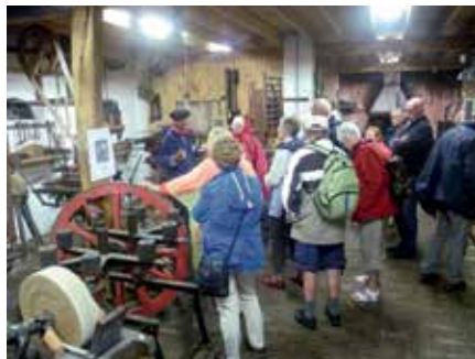
De wagenmaker in het karrenmuseum vertelt over zijn beroep