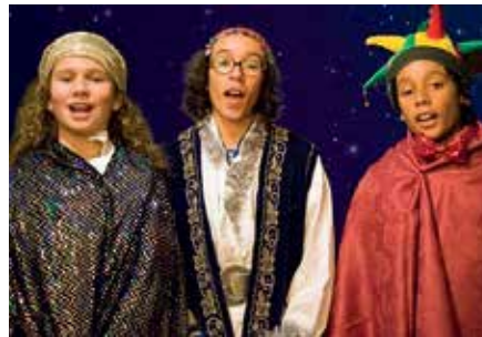
Driekoningenzingen als cultureel erfgoed

Om dit bijzondere element van ons immaterieel cultureel erfgoed te belichten is er op vrijdag 24 oktober in de raadszaal van het gemeentehuis in Tilburg een studiedag met als thema 'Driekoningen hier en elders in Europa'. Het is een feest met een lange geschiedenis en het is vaak afgebeeld op werken van bekende zeventiende- en achttiende-eeuwse schilders.