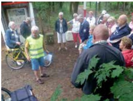
De gids vertelt over Klaver Vrouwke en de strandpaal

Komend jaar zijn er opnieuw heemdagen, maar de plaats waar die gehouden worden, is nog niet bekend. Bestuurslid Ad Jacobs is in overleg met verschillende kringen in Noord-Brabant om de dagen voor 2015 vast te leggen.